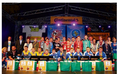
Najlepsze drużyny mistrzostw Polski tuż po dekoracji.

Zawodnicy z Wioski Dziecięcej w Rajsku wywalczyli tytuł wicemistrzów Polski po tym, jak wyszli z grupy na pierwszym miejscu, wygrywając w tej fazie również z drużyną, z którą przyszło im spotkać się ponownie w pojedynku o złoto. Tym razem los uśmiechnął się do rywali - drużyny ze Szczecina, która ostatecznie wywalczyła mistrzostwo.